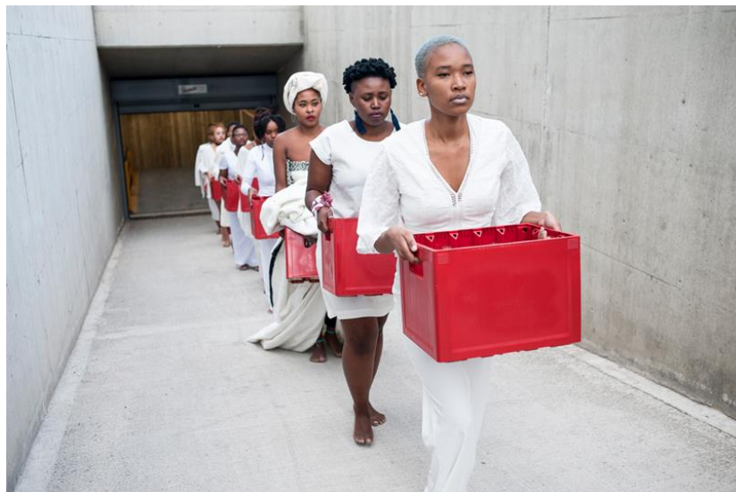
iQhiya, The Portrait , 2016, Performance, photo: Stathis Mamalakis

Das Parlament der Körper Kassel, 27.–29. April 2017